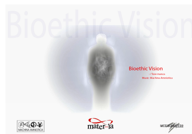
Bioethic Vision di Tore Manca